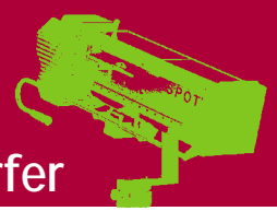
HZU 208 D/HZU 2508 D